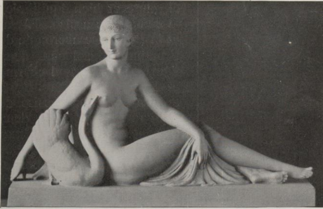
« Jeune fille au cygne », par Cormier.

nir cette tonalité claire, un peu jaunâtre, qui distinguent ses terres cuites.