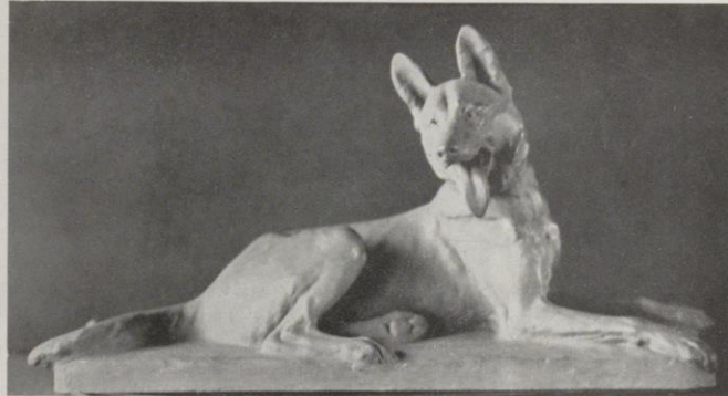
« Chien Berger d'Alsace », par Merculiano.