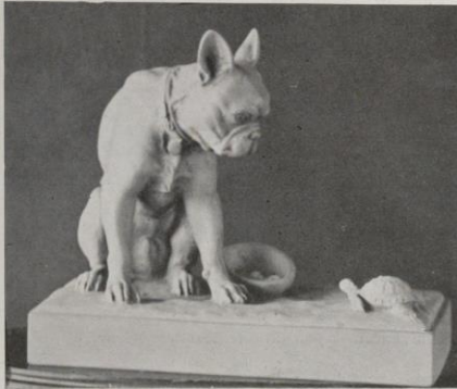
« Inquiétude », par Rouff.