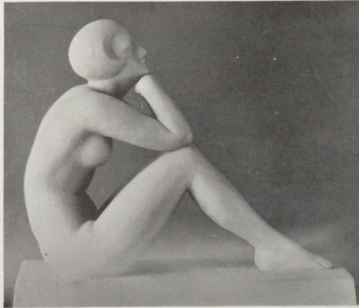
« Medita », par Guiraud-Rivière.

aussi la composition de Philippe et la statuette de Delabassé, dont nous aimons beaucoup le petit Chien et le Canard, groupe très amusant. N'oublions pas les charmants animaliers : Vacossin, Rouff Mercuriano, et louons de Fanny Rozet, un