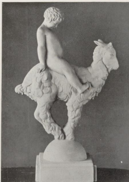
«Heureux âge», par F. Delabassé.

remarquer dans la décoration des céramiques, la crise mondiale, enfin, qui rend presque invendables des œuvres dont le prix augmente avec celui de la matière, tout cela est la cause de cette faveur dont jouit auprès du public la terre cuite. C'est pourquoi, en ce moment, il est fort intéressant d'étudier l'effort accompli par différents éditeurs qui ont suivi le mouvement et ont adopté la terre cuite pour la réalisation des œuvres des sculpteurs attachés à leurs maisons. Ainsi, MM.