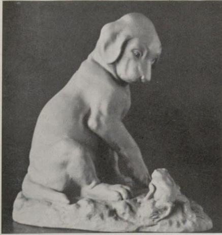
« Chiot et Grenouille », par Vacossin.

éviter l'écueil du mauvais goût, ce qui finirait par lasser le public. Et pourtant, grâce à la terre cuite, que de belles œuvres pourraient pénétrer dans un cadre plus vaste que celui, forcément restreint, de l'amateur d'art habituel.