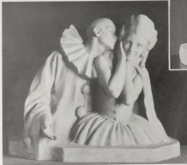
« Éternelle histoire », par Fanny Rozet.

aussi la composition de Philippe et la statuette de Delabassé, dont nous aimons beaucoup le petit Chien et le Canard, groupe très amusant. N'oublions pas les charmants animaliers : Vacossin, Rouff Mercuriano, et louons de Fanny Rozet, un