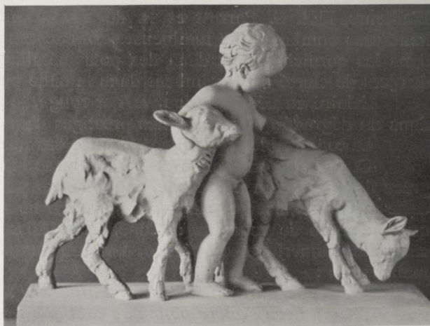
«Enfant aux chevreaux», par R. Falh.

remarquer dans la décoration des céramiques, la crise mondiale, enfin, qui rend presque invendables des œuvres dont le prix augmente avec celui de la matière, tout cela est la cause de cette faveur dont jouit auprès du public la terre cuite. C'est pourquoi, en ce moment, il est fort intéressant d'étudier l'effort accompli par différents éditeurs qui ont suivi le mouvement et ont adopté la terre cuite pour la réalisation des œuvres des sculpteurs attachés à leurs maisons. Ainsi, MM.