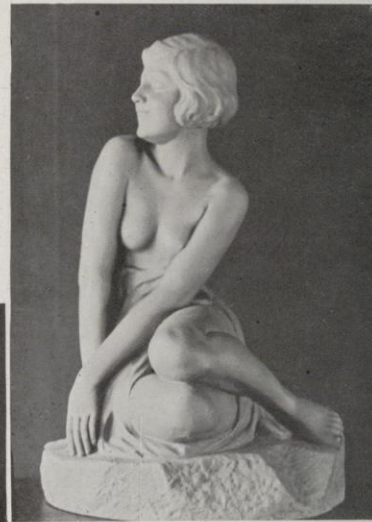
« Éveil », par Arsal.

élégante et bien équilibrée ; la Jeune fille assise, d'Arsal et la Danseuse accroupie de Frodman Cluzel sont deux figurines d'un grand charme et d'une maîtrise sûre. Il y a encore la Femme assise de Guiraud-Rivière, les deux figurines de Geneviève Granger, l'Enfant de R. Falh, très agréables, de lignes sobres et bien modelés. Remarquer